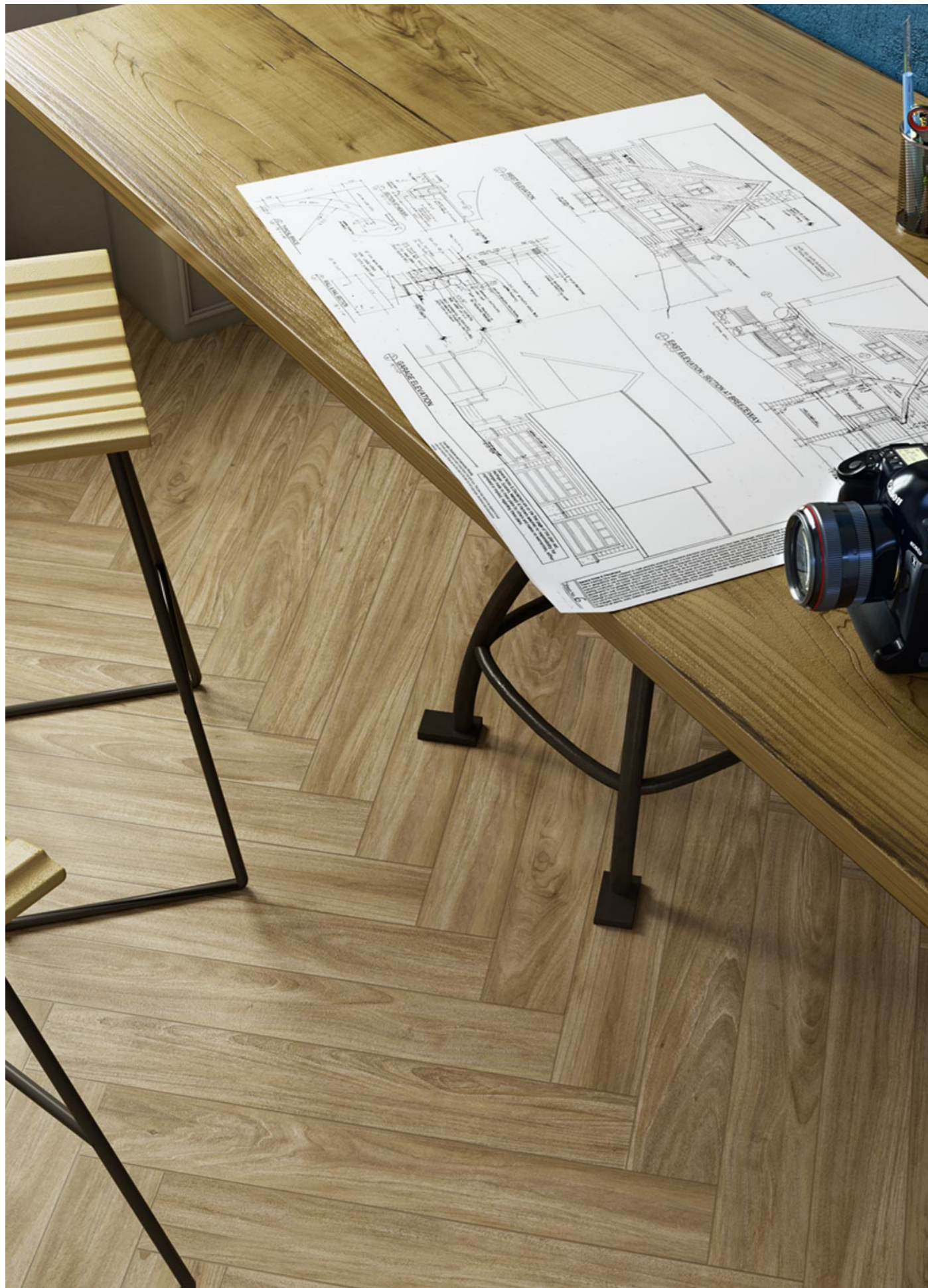
R4MF Woodessence Honey Woodessence 10x70cm