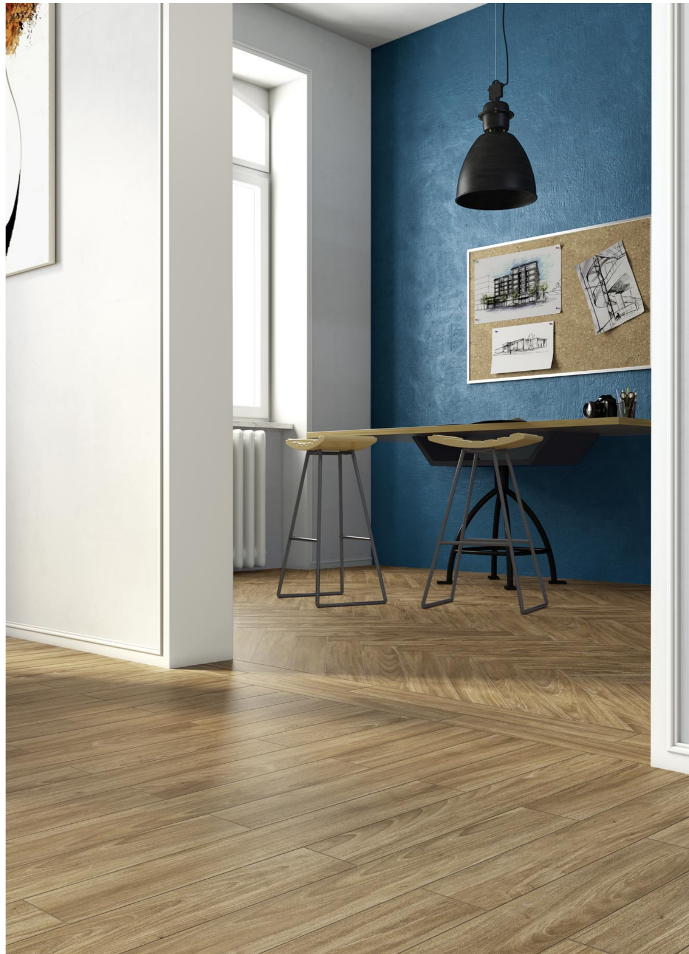
R4MF Woodessence Honey Woodessence 10x70cm