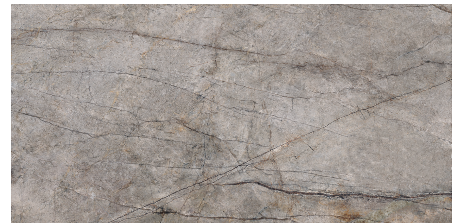
Rain Forest Natural Pul 60x120 R