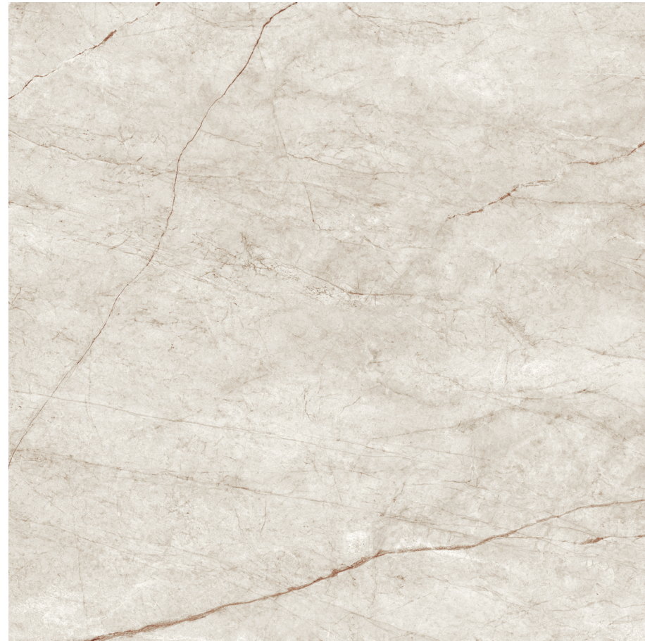
Rain Forest White Pul 120x120 R