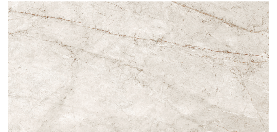
Rain Forest White 60x120 R