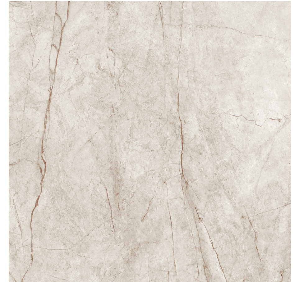
Rain Forest White Pul 120x120 R