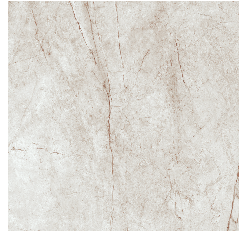
Rain Forest White Pul 100x100 R