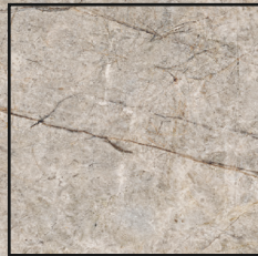
120x120 R 47¼"x47¼" R