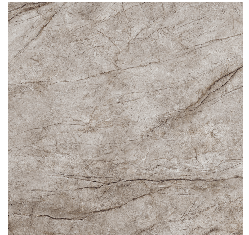
Rain Forest Natural Pul 100x100 R