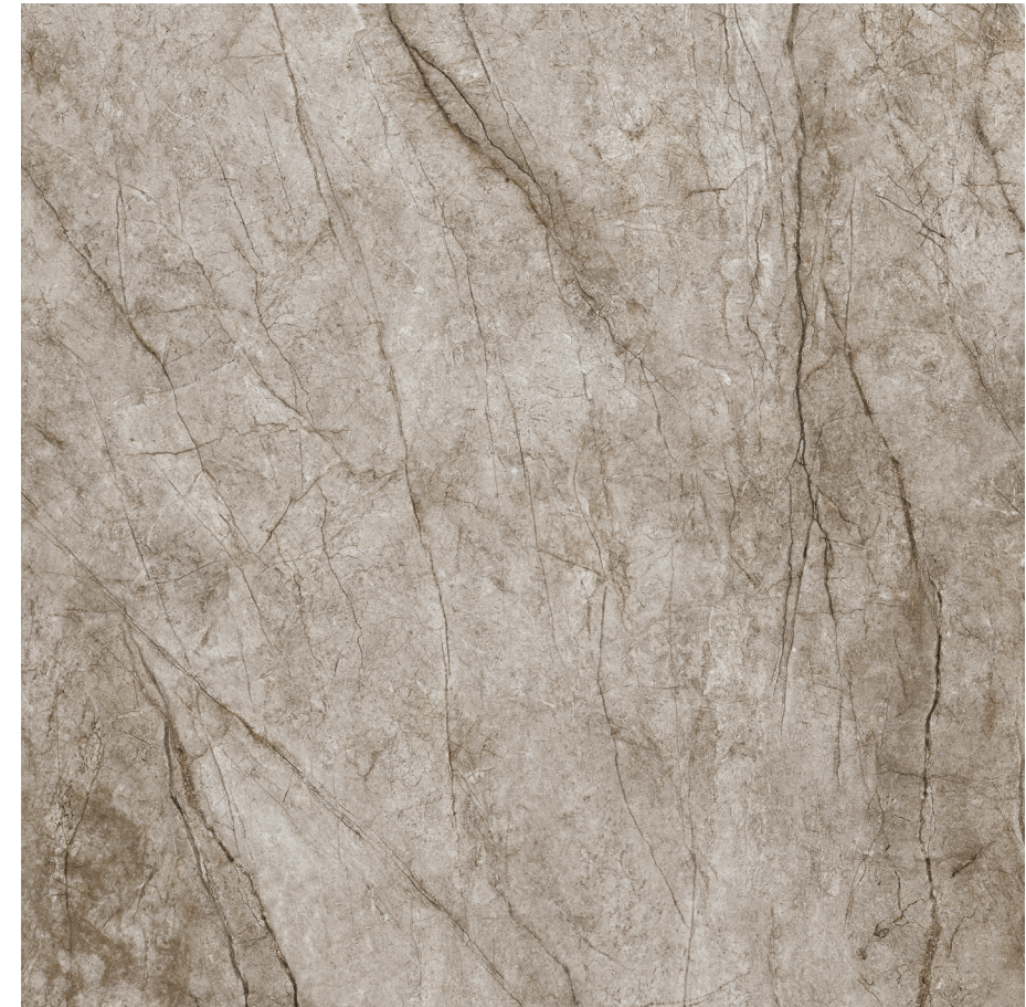
Rain Forest Natural Pul 120x120 R