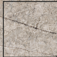
100x100 R 40"x40" R