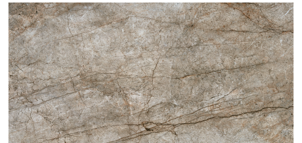
Rain Forest Natural 60x120 R