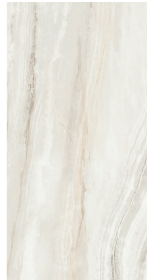
Mist Pearl Sat G461R