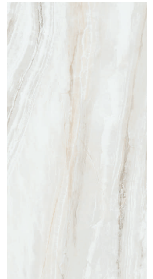
Mist Pearl Pul P460R