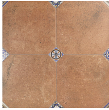
MANISES DECOR CUERO 58X58 - 22,8"X22,8"