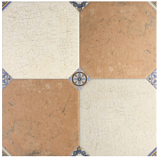
MANISES DECOR MIX 58X58 - 22,8"X22,8"