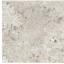
CAMELOT PERLA 58X58 - 22,8"X22,8"