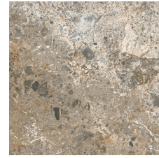
CAMELOT NATURE 58X58 - 22,8"X22,8"