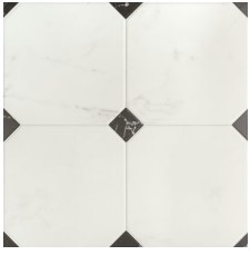
BETERA BLANCO 58X58 - 22,8"X22,8"