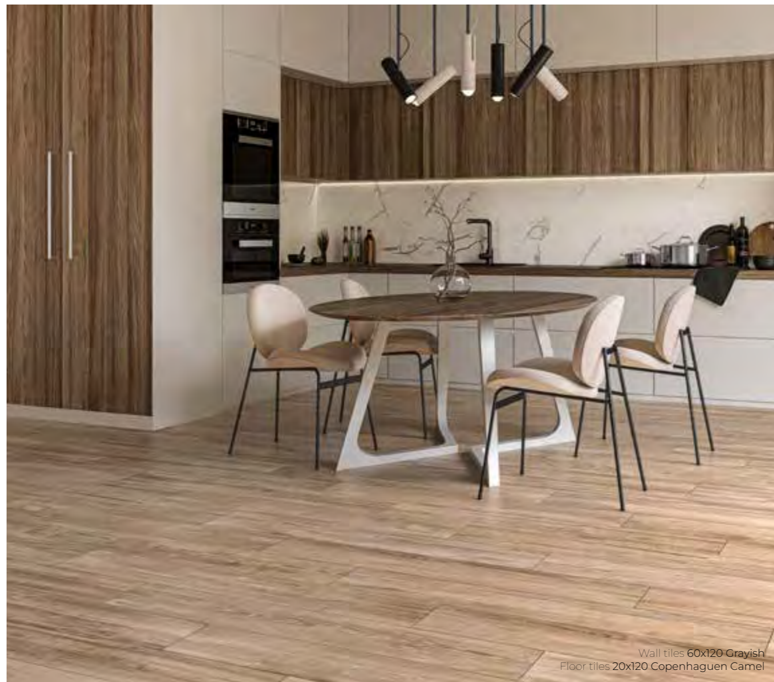
Wall tiles 60x120 Grayish Floor tiles 20x120 Copenhaguen Camel