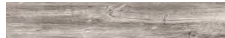
Copenhaguen Grey / ADZ