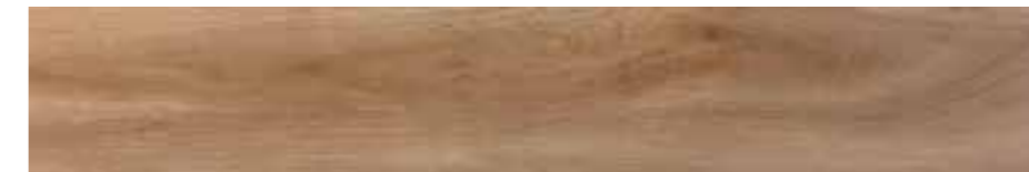
Kootenai Straw / ADZ